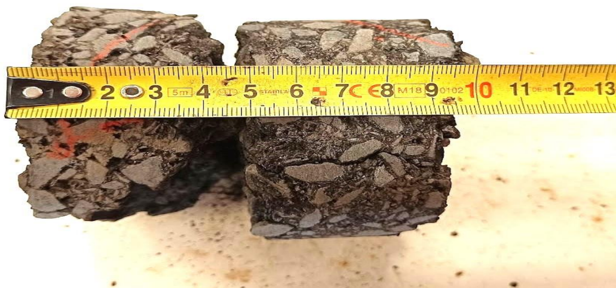
Jádrový vývrt č. 2