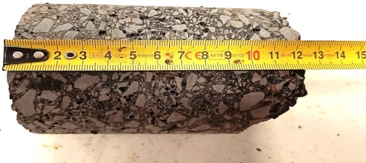
Jádrový vývrt č. 4